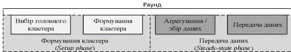
Рис. 2 Фази кластеризації

Як правило, методи кластеризації безпроводних сенсорних мереж класифікують, в загальному виді, по таким атрибутам: характеристики кластерів, характеристики головних вузлів кластеру, за процесом проведення кластеризації, за стадіями кластеризації.